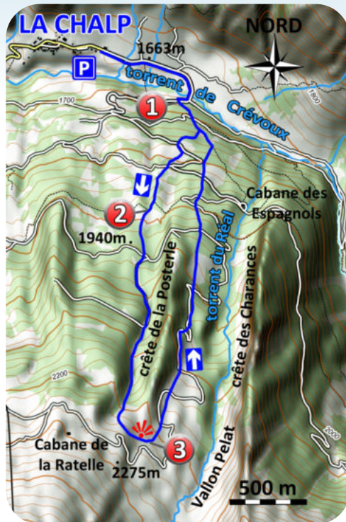
Carte IGN 3538 ET

Coordonnée GPS de la cabane de la Ratelle (32T - x : 0311174 y : 4932982)